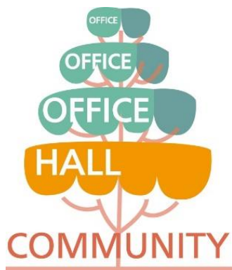
大きな-しろひげ-の木