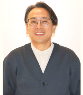
管理者 主任介護支援専門員 介護福祉士

も不安や葛藤、希望や喜びなどさまざまな想いを抱えるのではないのでしょうか。私たちは、そんな皆様の想いに寄り添いながら、介護のある生活が自然な風景になっていくよう、住み慣れたご自宅での生活を最期まで自分らしく過ごせるよう支援していきます。