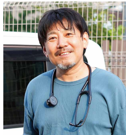
しろひげ在宅診療所 院長